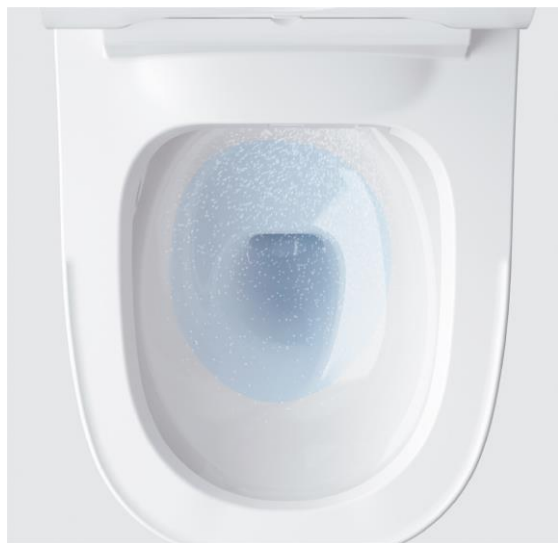
水アカと汚れのつきにくいスゴピカ素材で ツルンとキレイなトイレをキープ