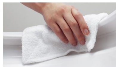
スキマや段差がほとんどないので ふき掃除がラクラク