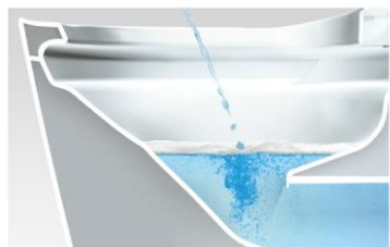
洗剤の泡がクッションになって トビハネを抑えるから床が汚れにくい