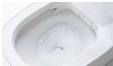
洗剤の泡と勢いのある水流で 流すたびに便器内をしっかりおそうじ

いまどきのトイレは自動で洗浄・汚れをガードし、ニオイもスッカリ。毎日おそうじしなくても、清潔感を保ちます。