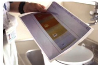
水回りの錆、作動状況をチェック。