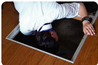
目の届きにくい場所もチェック

戸建てで最大17項目 97箇所、見えないところまで細かく建築士がチェック。「被災しやすい災害」に備えるためにも、一度プロの目で点検しませんか？